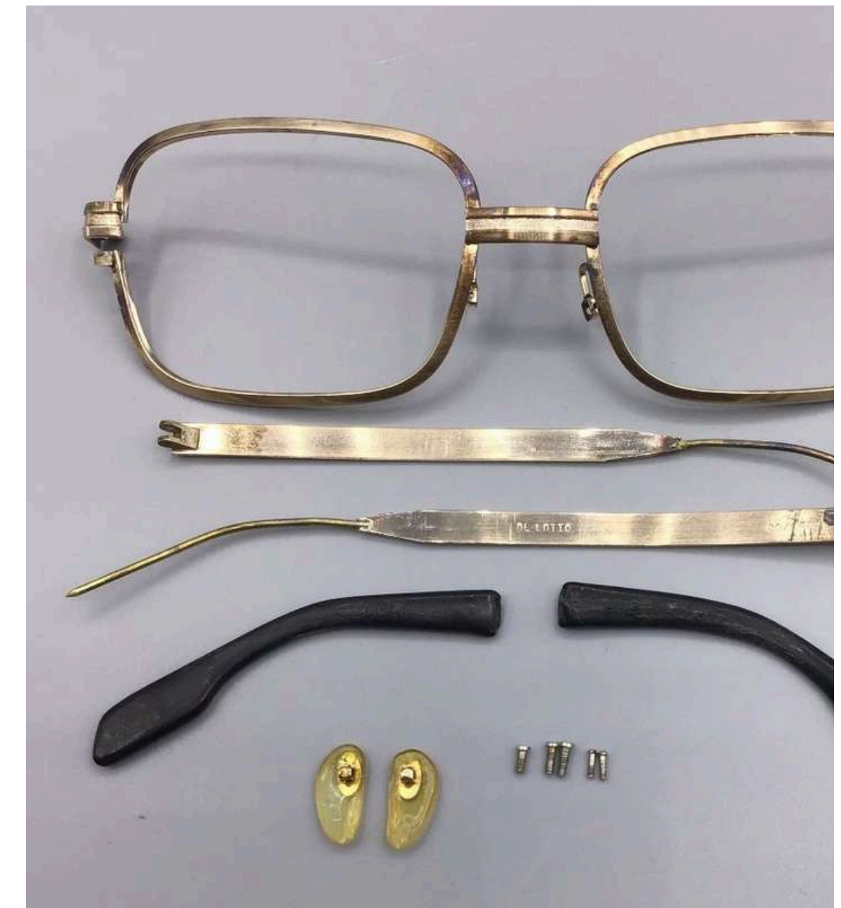
ALPACA, OTTONE, ZAMA